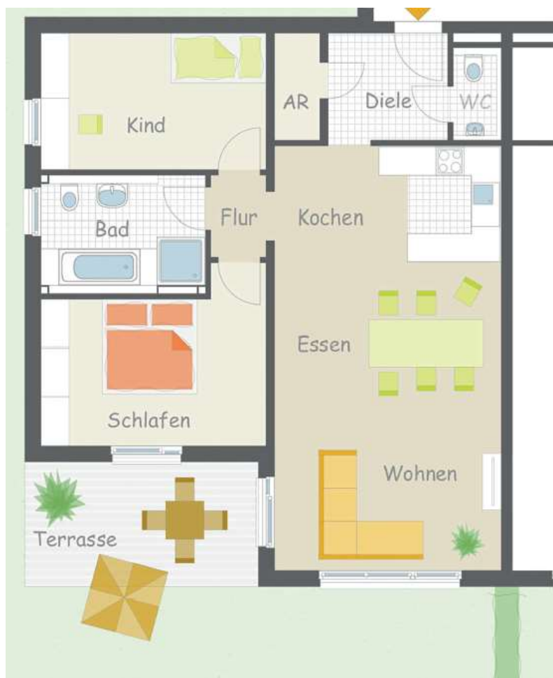
Wohnung 2 – Erdgeschoss Terrasse und eigener Gartenanteil

Vom Schlafzimmer auf die Terrasse. Perfekte Südausrichtung mit sehr schönem Gartenanteil, offenem Wohn-, Essbereich mit Küche, WC und Badezimmer, sowie ein Abstellraum.