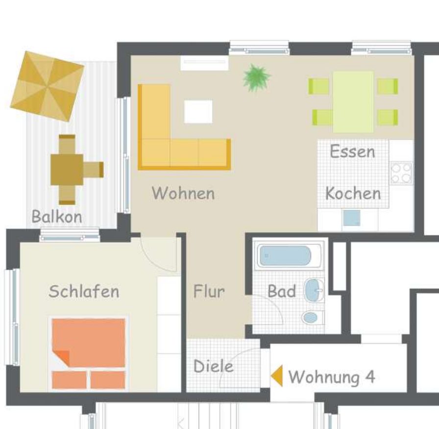
Wohnung 4 – 1. Obergeschoss Balkon

Geräumige 2 Zimmer Wohnung, offener Wohn-/ Essbereich mit großem Balkon in Süd-/Westausrichtung zum Entspannen.