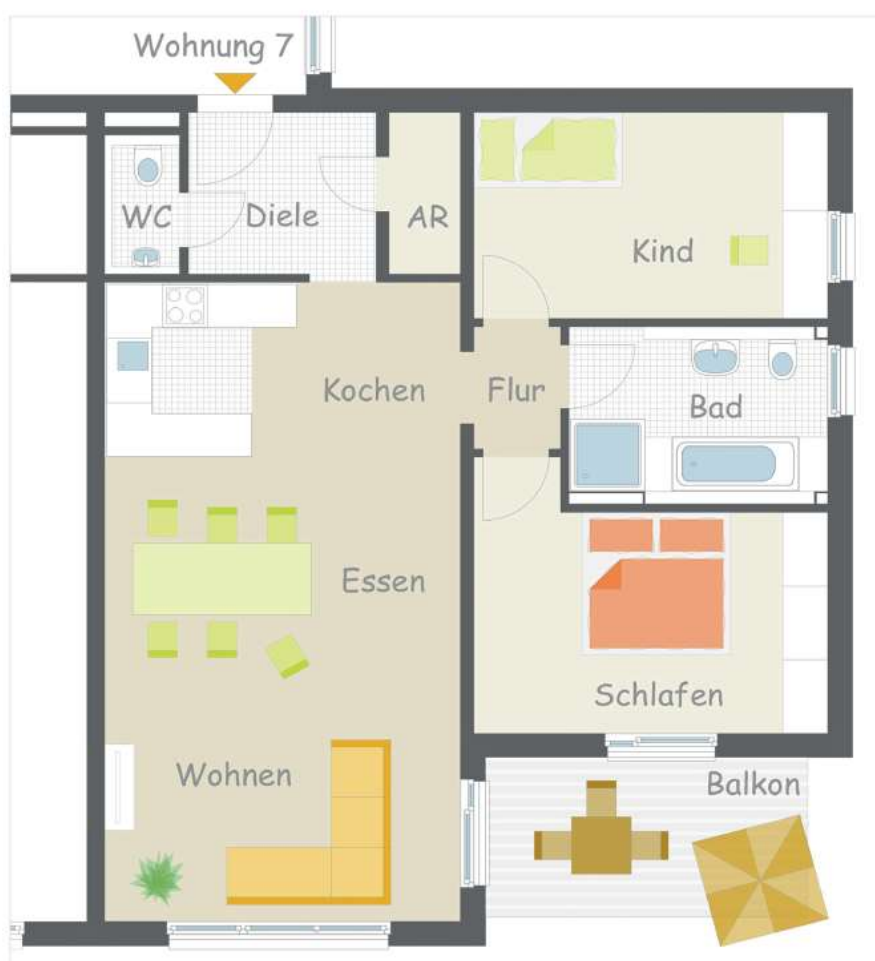
Wohnung 7 – 1. Obergeschoss – Balkon

Nach dem Feierabend ab auf den großen Balkon mit toller Südausrichtung! Des Weiteren erwartet Sie ein offener Wohn-, Essbereich mit Küche, WC und Abstellraum.